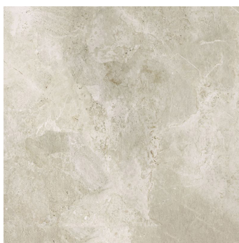
Great Platinum White